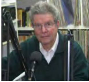
Έρευνα και επιμέλεια κειμένων Δημήτρης Συμεωνίδης JP Δημοσιογράφος /Ανταποκριτής Ε.Σ.Ε.Μ.Ε. (Ένωση Συντακτών Ευρωπαϊκών Μέσων Ενημέρωσης)

«Ας Φρόντιζαν» Από τα Αναγνωρισμένα Ποιήματα Αρχείο Καβάφης (Ίδρυμα Ωνάση)