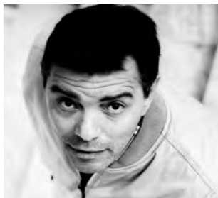
Γράφει ο Σπύρος Παπαστεφάνου

Γοττευμένος τόσο από την μουσική θεωρία της Βυζαντινής μουσικής όσο και από στοιχεία της παραδοσιακής μας μουσικής παράδοσης, συνθέτει με τον δικό του μοναδικό τρόπο.