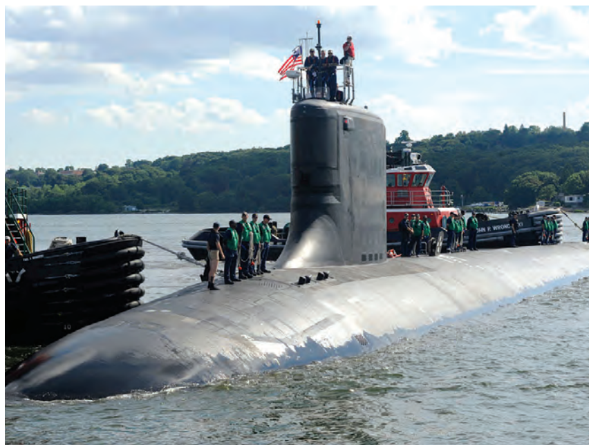
Τί έχουμε περισσότερο ανάγκη σήμερα και τί μας συμφέρει; Υποβρύχια, ή σπίτια;

Θυμάμαι τα χρόνια τα παλιά στην Αυστραλία και σκέπτομαι πώς καταντήσαμε έτσι σήμερα; Τότε που στο Αντελάϊντ το 1957 πλήρωνα ενοίκιο 7 λίρες (14 δολάρια) την εβδομάδα με μισθό $70 και αργότερα έκτισα το πρώτο σπίτι μου με προκαταβολή που με δάνεισε ο εργοδότης.