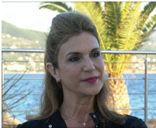
Η πρέσβης του Παναμά στην Ελλάδα, Τζούλι Λυμπερόπουλος

Ο Υπουργός Ανάπτυξης και Επενδύσεων τόνισε ότι υποστηρίζει την ίδρυση πρεσβείας στον Παναμά, πράγμα το οποίο θα εισηγηθεί και ευχαρίστησε τον κ. Τάκη για την προσφορά του να στηρίξει οικονομικά τη λειτουργία της πρεσβείας.