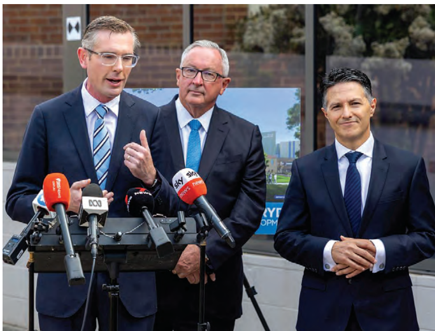
Ο Πρόεδρος Ντόμνικ Περροτέτ σε συνέντευξη Τύπου με τους υποστηρικτές υπουργούς του, Μπραντ Χάζαρντ και Βίκτωρ Ντομινέλλο.

Εκείνο που κατά την γνώμη μου έχει σημασία είναι το γεγονός ότι το σκάνδαλο απεκάλυψε ηγετικά στελέχη στην κυβέρνηση Περροτέτ, κυρίως ο υπουργός Μεταφορών, Ντέβιντ Ελλιοτ, ο οποίος έχει συγκρουστεί με τον πρόεδρο, επειδή άλλαξε τους κανόνες λειτουργίας των τυχερών