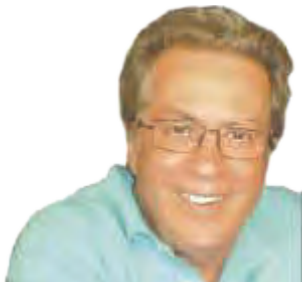
Γράφει ο Γιώργος Μεσσάρης

Η σειρά αυτή των δημοσιευμάτων για τους Κεφαλονίτες και Ιθακήσιους της Αυστραλίας αποτελούν διασκευή πρόσφατων ομιλιών μου στο Αργοστόλι και το Βαθύ.