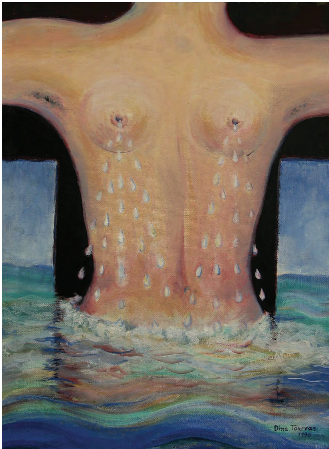
Ροές. Ελαιογραφία σε καμβά, Σίδνεϊ 1990

γαν κατά κανόνα τα θέματα που σχετίζονται με την εγκυμοσύνη και την μπρότητα. Ήταν ένα θέμα που τους προκαλούσε άγχος και το αγνόσαν τα πρώτα χρόνια ανάπτυξης του κινήματος.