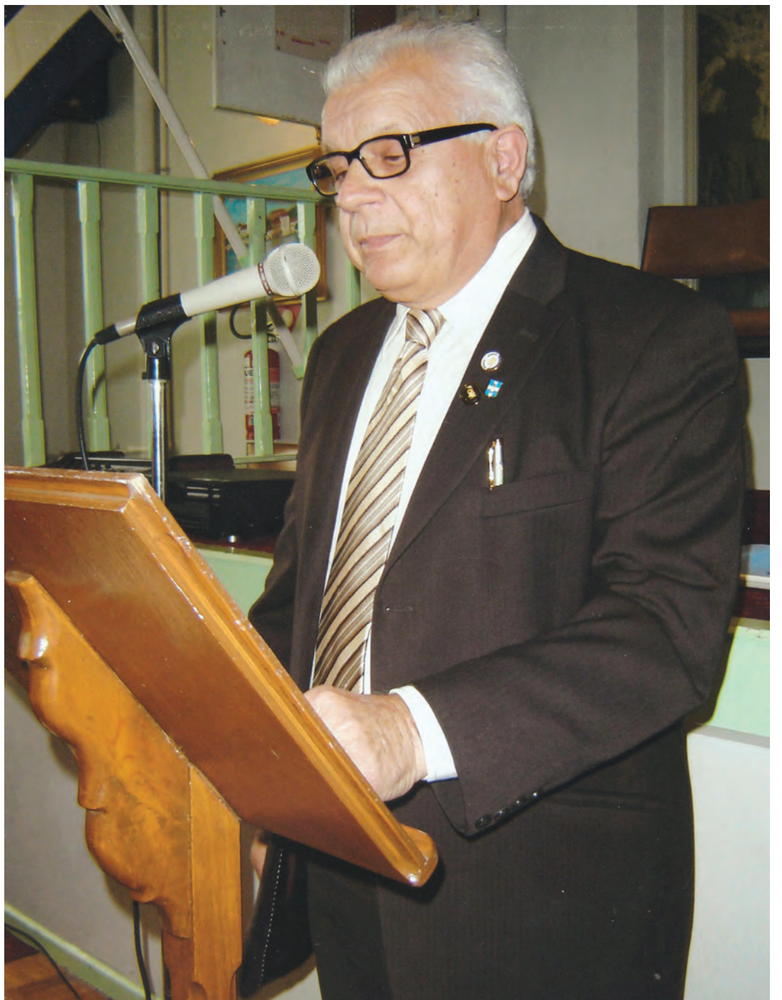
Ο ποιητής Γεράσιμος Κλωνής.