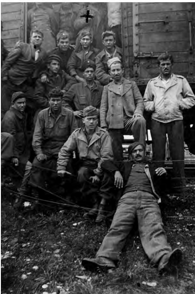
Κοκκινιώτες σε κάποια στάση του τρένου του επαναπατρισμού, κάπου μεταξύ Μονάχου και Ιταλίας, 8 Αυγούστου 1945

Οι μαζικοί εκτοπισμοί όχι μόνο αυξήθηκαν κατακόρυφα (δύο στους τρεις ομήρους όλης της κατοχικής περιόδου εκτοπίστηκαν το καλοκαίρι του 1944), αλλά άρχισαν να χάνουν και τα προσχήματα της «αντισυμμοριακής» καταστολής. Τον Ιούλιο, ο Στρατιωτικός Διοικητής Ελλάδας είχε διατάξει ως προληπτικό μέτρο «κατά εσωτερικών ταραχών [...] την αιφνιδιαστική σύλληψη σε ορισμένες κομμουνιστικές αθηναϊκές συνοικίες όλων των ανδρών ηλικίας μεταξύ 16 και 50 ετών, εφόσον δεν εργάζονται για τη γερμανική Βέρμαχτ ή για άλλα γερμανικά συμφέροντα και να τους στείλει αμέσως για εργασία στη Γερμανία». Η διαταγή αυτή υλοποιήθηκε στα αιματηρά «μπλόκα» που εξαπέλυσαν δυνάμεις των Ες-Ες και των δωσιλογικών Ταγμάτων Ασφαλείας σε όλες τις «κόκκινες» συνοικίες της Αθήνας: Παγκράτι (4 Ιουλίου), Περιστερί (6 Ιουλίου), Γκύζη (14 Ιουλίου), Βύρωνα (7 Αυγούστου), Δουργούτι, Νέος Κόσμος, Νέα Σμύρνη (9 Αυγούστου), Κοκκινιά (17 Αυγούστου), Καλλιθέα (24 και 28 Αυγούστου). Τα τρία μεγαλύτερα μπλόκα, σε Βύρωνα, Δουργούτι και Κοκκινιά,