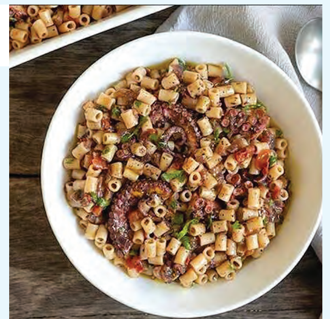
Προσθέτουμε το θυμάρι και σερβίρουμε με έξτρα ελαιόλαδο.

άκρη προσθέτοντας λίγο ελαιόλαδο. Ψιλοκόβουμε το κρεμμύδι και το σκόρδο. Τοποθετούμε ένα τηγάνι σε μέτρια προς δυνατή φωτιά και όταν κάψει προσθέτουμε 1 κ.σ. ελαιόλαδο και το κρεμμύδι. Σοτάρουμε για 2-3 λεπτά ανακατεύοντας μέχρι να μαλακώσει. Προσθέτουμε το σκόρδο και σοτάρουμε πολύ λίγο ακόμα, για μισό λεπτό περίπου. Σβήνουμε με το ούζο και το αφήνουμε 1-2 λεπτά μέχρι το αλκοόλ να εξατμιστεί. Προσθέτουμε το χταπόδι σε κονσέρβα και τα ζυμαρικά. Ρίχνουμε αλάτι και πιπέρι δεν θέλει όμως πολύ γιατί η σάλτσα από το χταπόδι είναι ήδη πικάντικη. Ανακατεύουμε και τα αφήνουμε να μαγειρευτούν 1-2 λεπτά μέχρι η σάλτσα να δέσει.