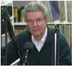
Έρευνα: Δημήτρης Συμεωνίδης

Θ α επικαλεστώ την Μούσα Κλειώ (κλέος=δόξα, την Μούσα της Ιστορίας...να συνδράμει να παρουσιάσω τα διασωθέντα στοιχεία για τις αρχαίες Ελληνίδες ιστορικούς. Οι Μούσες στην αρχαία ελληνική μυθολογία (θηλυκού γένους) είναι εννέα αρχαίες θεότητες, κόρες του Δία και της Μνημοσύνης. Ο θεός Απόλλωνας ήταν ο γέτης τους (Απόλλων Μουσαγέτης).