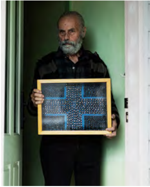
Ο Ζωγράφος και συγγραφέας Γιώργος Μιχελακάκης

Κουλτούρα και Τέχνη στην εποχή της παγκοσμιοποίησης