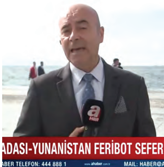
ADASI-YUNANISTAN FERİBOT SEFERİ A HABER TELEFON: 444 888 1 www.ahaber.com.tr MAIL: HABER@A

«Ο τουρισμός ανάμεσα στα νησιά του Αιγαίου και την Τουρκία ή καλύτερα με τις ακτές και τις πόλεις της Τουρκίας γινόταν με πλοία τύπου καταμαράν» λέει ο δημοσιογράφος στον τουρκικό τηλεοπτικό σταθμό «A Haber». «Όταν αυτό δεν κατέστη δυνατό ο τουρισμός επηρεάστηκε αρνητικά και για αυτό πλέον από σήμερα άρχισαν τα δρομολόγια με φέριμποτ από το Κουσάντασι του νομού Αϊδινίου προς τη Σάμο και την Πάτμο» προσθέτει στο ρεπορτάζ του, σύμφωνα με τα tourkikaneagr . Και ενημερώνει ότι «Κατά τον ίδιο τρόπο αρχίζουν δρομολόγια φέριμποτ στις 13 Απριλίου από Αϊβαλί και στις 14 Απριλίου από τη Μυτιλήνη». Για να καταλήξει: «Σχετικά με τη Μυτιλήνη, στην