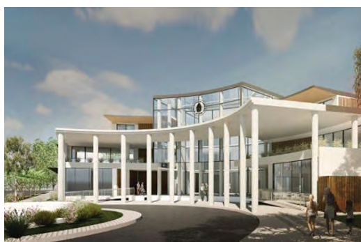
Σχέδιο του Πολιτιστικού Κέντρου που θα κτίσει η Κοινότητα.

Πρόσφατα η Κοινότητα δημοσιοποίησε τα σχέδια για την ανοικοδόμηση ενός εντυπωσιακού Πολιτιστικού Κέντρου... και την πείρα έχει από πολιτιστικές δραστηριότητες και τους κατάλληλους ανθρώπους και τα χρήματα που θα χρειαστούν για την πραγματοποίηση ενός τόσο μεγάλου έργου.