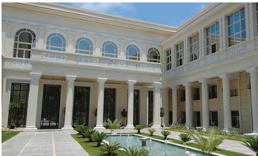
Το Πατριαρχείο Αλεξανδρείας και πάσης Αφρικής αποφάσισε να αξιοποιήσει όλα τα θεσμικά «όπλα».

Η ανακοίνωση της Ρωσικής Εκκλησίας, στις 29 Δεκεμβρίου, περί ίδρύσεως Αφρικανικής Εξαρχίας ενεργοποιεί μια σειρά από αντιδράσεις. Βεβαίως, δεν αποτέλεσε κεραυνό εν αιθρία, αλλά την τελευταία πράξη μιας σειράς ενεργειών που ήρθαν ως αντίδραση στην απόφαση για αναγνώριση της Αυτοκεφαλίας της Ουκρανικής Εκκλησίας. Το Πατριαρχείο Αλεξανδρείας καταγγέλλει ότι έγινε μια συστηματική εκστρατεία – εισπήδηση στις περιοχές δικαιοδοσίας του από εκπροσώπους της Ρωσικής Εκκλησίας, οι οποίοι προσέγγισαν κληρικούς με στόχο τη στρατολόγησή τους. Αφήνονται, μάλιστα, σαφείς υπαινιγμοί για χρηματισμό. Αλλωστε, σε εγκύκλιο που απηύθυνε προς τους κληρικούς και τους πιστούς της Αφρικής μόλις την περασμένη Πέμπτη, ο Πατριάρχης Αλεξανδρείας κ. Θεόδωρος κάνει αναφορά σε «ψευδοποιημένες» που κινήθηκαν για να «ενσπείρουν ζιζάνια διχασμού», ενώ προσθέτει ότι «πότισαν με κατηγορίες κατά του Πατριαρχείου μας και με βρώμικα