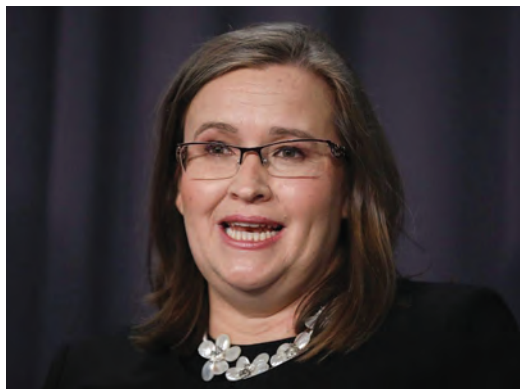
Η Επίτροπος για τις διακρίσεις λόγω φύλου, Κέιτ Τζένκινς.

Σύμφωνα με την έκθεση της Κέιτ Τζένκινς, το 51% των εργαζομένων στο κοινοβούλιο είχαν την εμπειρία ενός τουλάχιστον εκφοβισμού, σεξουαλικής παρενόχλησης ή κακοποίησης, ενώ το 77% είχε την εμπειρία, το είχε ακούσει ή ήταν μάρτυρας τέτοιας συμπεριφοράς