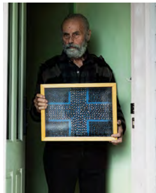
Ο Ζωγράφος και συγγραφέας Γιώργος Μιχελακάκης

Κουλτούρα και Τέχνη στην εποχή της παγκοσμιοποίησης