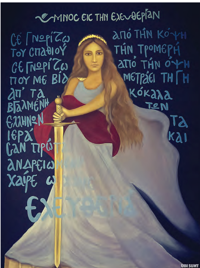
Ύμνος εις την Ελευθερίαν, 1,20m x 1m