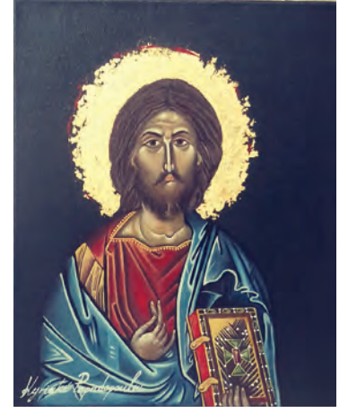
Ιησούς Χριστός, (αγιογραφία), 20 x 25cm