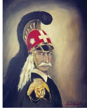
Πορταίτο Θεόδωρου Κολοκοτρώνη, 41 x 51cm