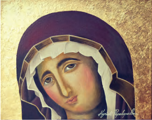
Θεοτόκος, (αγιογραφία), 20 x 25cm