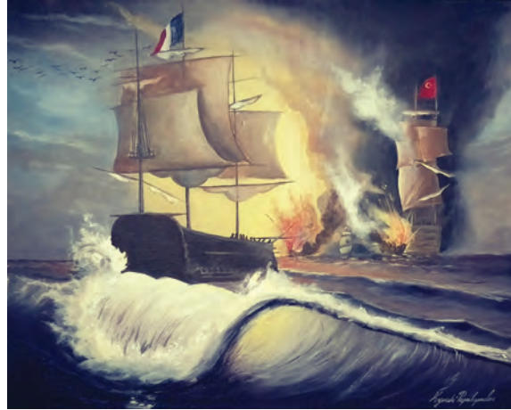
Η Ναυμαχία του Ναυαρίνου, 41 x 51cm