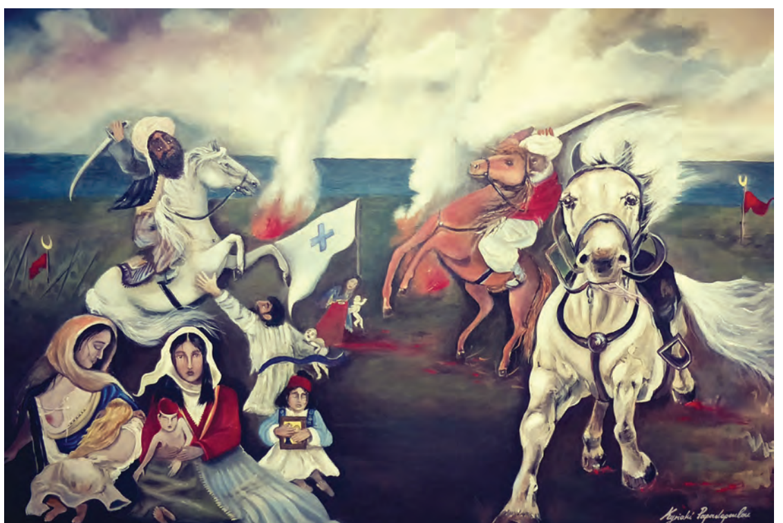
Η Σφαγή της Χίου, 61 x 92cm

Η Παπαδοπούλου ζωγραφίζει θέματα ιστορικά, πορταίτα των αγωνιστών της επανάστασης και αγιογραφίες.