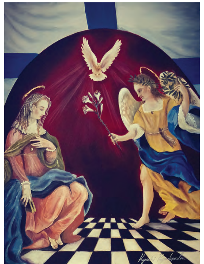
Ο Ευαγγελισμός της Θεοτόκου, 31 x 41cm

Μ ια σειρά από πίνακες που η πανδημία δεν επέτρεψε να εκτεθούν δημόσια της ζωγράφου Κυριακής Παπαδοπούλου προσφέρονται από σήμερα σε όσους ενδιαφέρονται για τα θέματα της Ελληνικής Επανάστασης του 1821 αλλά και την αγιογραφία. Η Παπαδοπούλου ζωγραφίζει θέματα ιστορικά όπως η Ναυμαχία του Ναυαρίνου, Η σφαγή της Χίου, Το Κρυφό Σχολείο, οι Σουλιώτισσες και πορταίτα των αγωνιστών της επανάστασης όπως ο Θεόδωρος Κολοκοτρώνης, ή θέματα με αναφορές στις λαϊκές παραδόσεις όπως η Προσευχή, αλλά και βυζαντινότροπα, όπως η Θεοτόκος, ο Ιησούς Χριστός και Ευαγγελισμός της Θεοτόκου. Με αναφορές στα έργα των Peter Von Hess και Jean-Charles Langlois που επίσης ζωγράφισαν σκηνές από την επανάσταση, η ζωγράφος προσφέρει μια μοναδική ευκαιρία στο κοινό να αποκτήσει ένα αυθεντικό πίνακα, ενθύμιο της σημαντικής επετείου των 200 χρόνων. Οι ενδιαφερόμενοι μπορούν να επικοινωνήσουν μαζί της στο τηλ.: 0426 458 701.