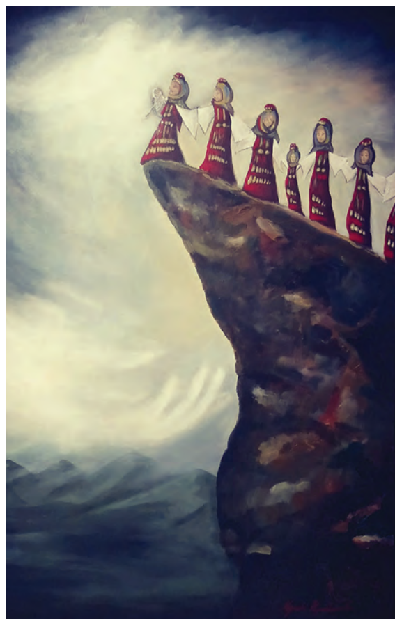
Σουλιώτισσες, 51 x 76cm