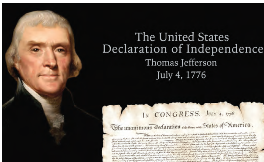
«Όποτε ένας άνθρωπος βάζει στο μάτι υψηλές θέσεις, ένα είδος σαπίλας εμφανίζεται στη συμπεριφορά του.» - Τόμας Τζέφερσον, 1749-1826, Αμερικανός πρόεδρος [1801-1809]

Πολύ απλά, θα ήθελα μια ομογένεια χωρίς εθνοτοπικά σωματεία, αλλά με μια μόνο συνομοσπονδία τού Ελληνισμού με περιουσία εκατοντάδων εκατομμυρίων δολαρίων, που τώρα ανήκουν σε οργανισμούς οι οποίοι φυτοζωούν και θα τους φάει μαύρο φίδι. Όπως τις εκατοντάδες