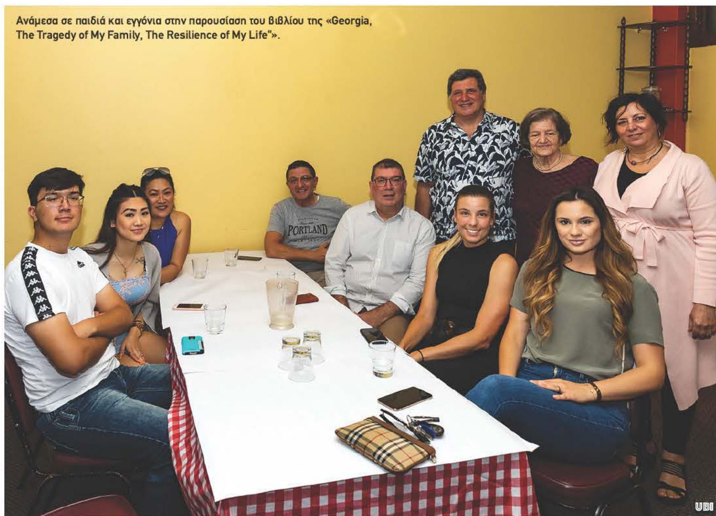
Ανάμεσα σε παιδιά και εγγόνια στην παρουσίαση του βιβλίου της «Georgia, The Tragedy of My Family, The Resilience of My Life».