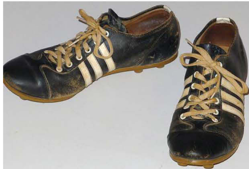
ΣΤΗ ΦΩΤΟΓΡΑΦΙΑ: Ποδοσφαιρικά παπούτσια... Το δώρο που μ' έκανε να πετάξω στα... σύννεφα!

Κι' έτσι κάθομαι και σπάω το μυαλό μου να βρω κάτι διαφορετικό να κάνω. Μια νέα απα-