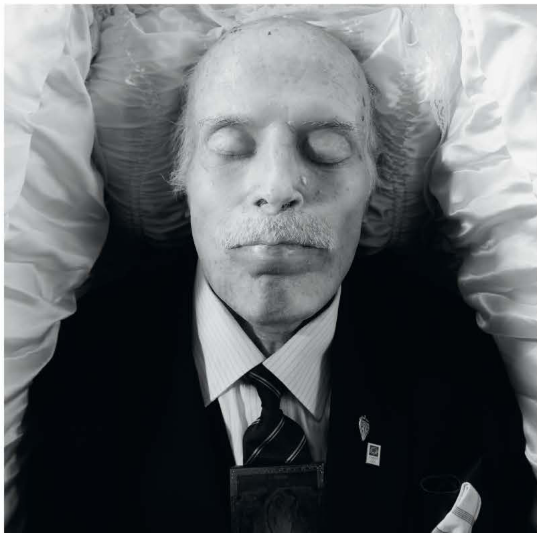
THE GENERAL 2019

«...Θα ήθελα να προσθέσω 50 λέξεις που έχουν ειπωθεί ή γραφτεί για το έργο μου τα τελευταία 50 χρόνια χωρίς καμία συγκεκριμένη σειρά: