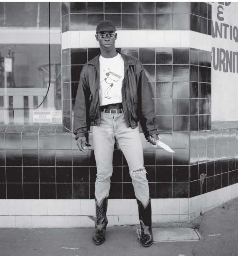
MARRICKVILLE FISHKNIFE CHIC 1989