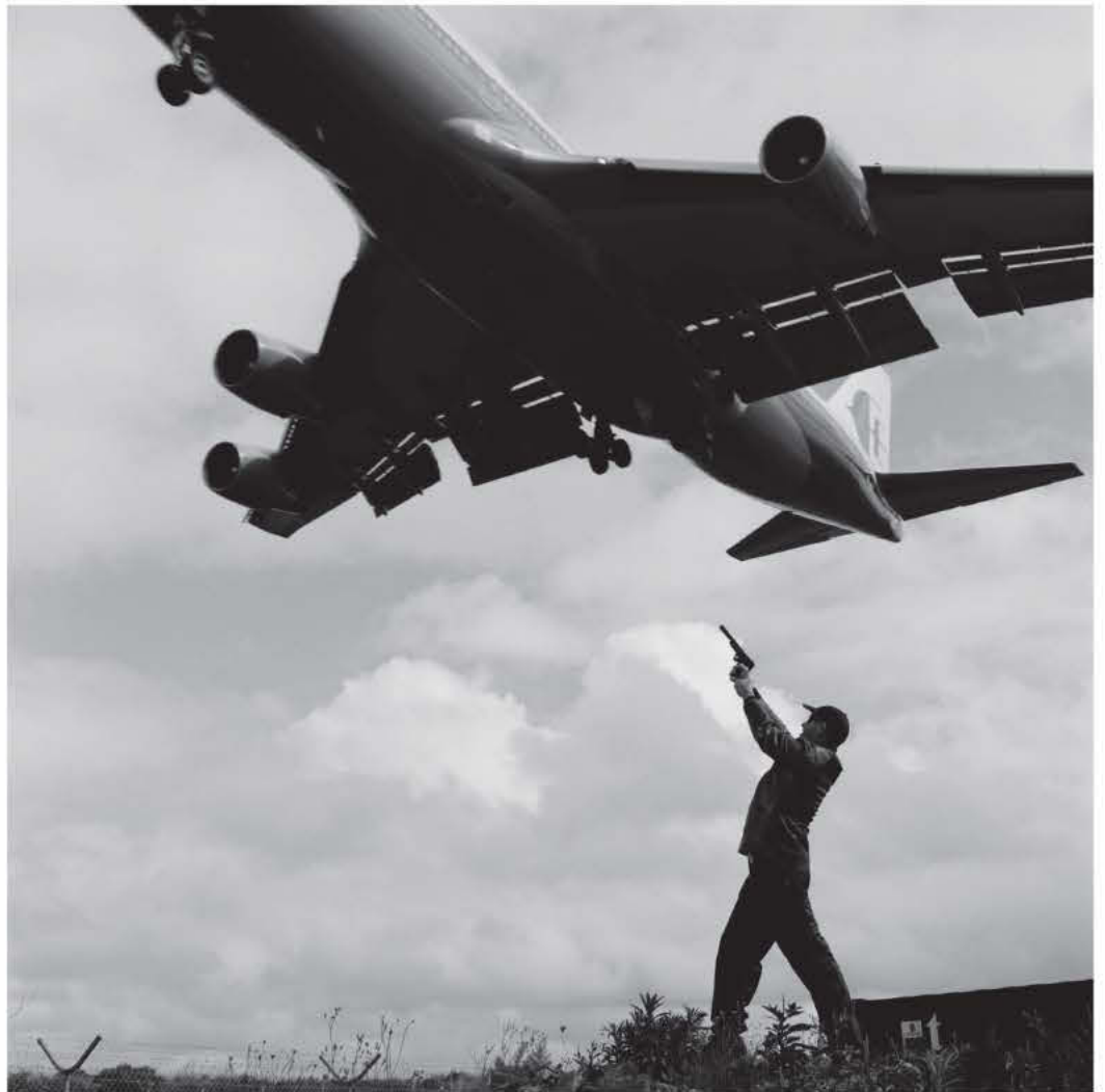
URBAN TERRORIST 2000