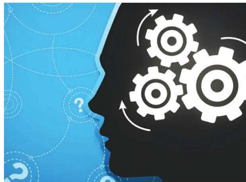
ΣΤΗ ΦΩΤΟΓΡΑΦΙΑ: Η κοινή λογική είναι, σε πολλές περιπτώσεις το ζητούμενο...

Μέχρι και το Χριστό, μαθαίνω, θέλουν να τον κάνουν μαύρο