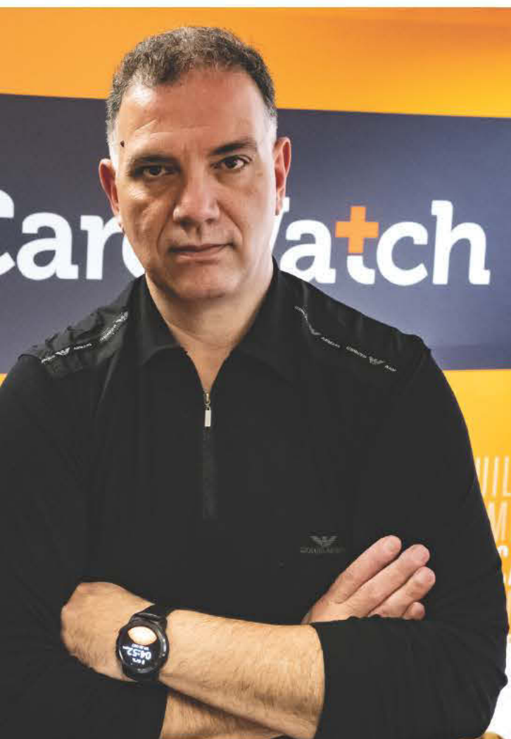
ει ζωές, τα ελληνικής καταγωγής αδέρφια,

χρειαστεί επαναφόρτιση και ειδοποιεί φωνητικά το χρήστη του για αυτό όπως και την οικογένεια του. Επίσης δεν χρειάζεται ο κάτοχος του να κάνει τίποτα απολύτως καθώς διατίθεται έτοιμο και προγραμματισμένο από την εταιρία. Χάρη στο πολύ εύκολο στη χρήση λογισμικό του μπορείτε να αλλάξετε ανά πάσα στιγμή τις επαφές επικοινωνίας ή να προγραμματίσετε τις υπενθυμίσεις για τον άνθρωπο σας.