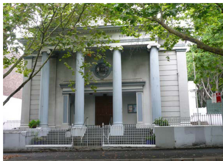
Πάνω: Τραπεζάκι στην είσοδο της Αρχιεπισκοπής με το πρόγραμμα του Ελληνικού Φεστιβάλ Σίδνεϊ. Αριστερά: Η Αγία Σοφία, ένα αρχιτεκτονικό και ιστορικό στολίδι που αυτή την περίοδο ανακαινίζεται υποδειγματικά

την προστασία των ενοίκων του και του προσωπικού. Αυστηρά μέτρα, που απαγορεύουν τις επισκέψεις ακόμη και σε όσους δεν έχουν κάνει το εμβόλιο της γρίπης.