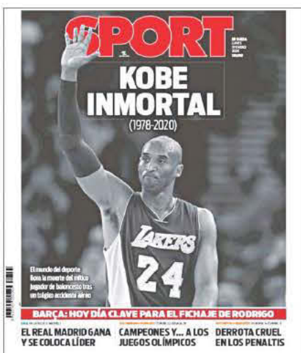
SPORT (ΙΣΠΑΝΙΑ) - ΑΘΑΝΑΤΟΣ ΚΟΜΠΙ