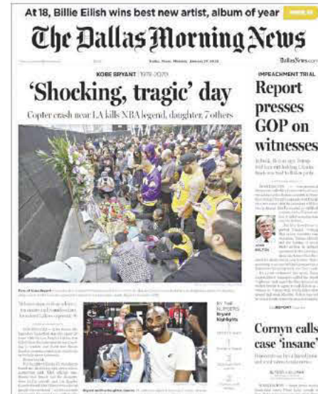
THE DALLAS MORNING NEWS (ΗΠΑ) - ΣΟΚΑΡΙΣΤΙΚΑ ΤΡΑΓΙΚΗ ΗΜΕΡΑ

Σύμφωνα με όσα ηχητικά ντοκουμέντα έχουν διαρρεύσει, ακούγεται να λένε στον πιλότο του μοιραίου ελικοπτέρου πως "συνεχίζεις να πετάς πολύ χαμηλά" σε τέτοιο βαθμό που δεν ήταν εύκολο να εντοπιστεί από τα ραντάρ και να του δοθούν κατευθύνσεις.