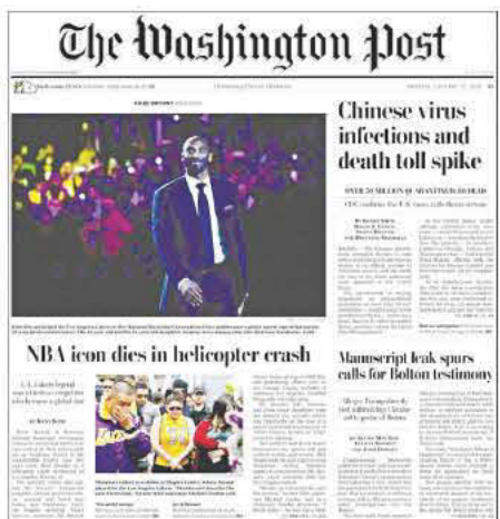
THE WASHINGTON POST (ΗΠΑ) - ΤΟ ΙΝΔΑΛΜΑ ΤΟΥ ΝΒΑ ΣΚΟΤΩΘΗΚΕ ΣΕ ΔΥΣΤΥΧΗΜΑ ΜΕ ΕΛΙΚΟΠΤΕΡΟ