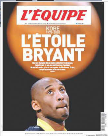
L'ÉQUIPE (ΓΑΛΛΙΑ) - Ο ΑΣΤΕΡΑΣ ΜΠΡΑΪΑΝΤ