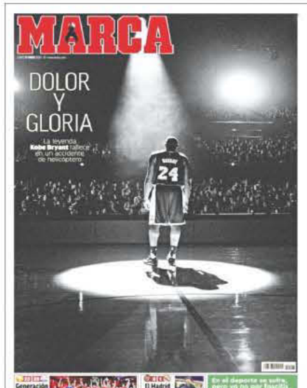
MARCA (ΙΣΠΑΝΙΑ) - ΠΟΝΟΣ ΚΑΙ ΔΟΞΑ