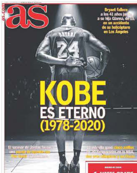
AS (ΙΣΠΑΝΙΑ) - Ο ΚΟΜΠΙ ΕΙΝΑΙ ΑΙΩΝΙΟΣ