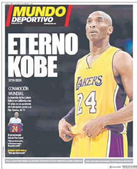
MUNDO DEPORTIVO (ΙΣΠΑΝΙΑ) - ΑΙΩΝΙΟΣ ΚΟΜΠΙ