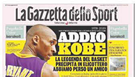
GAZZETTA DELLO SPORT (ΙΤΑΛΙΑ) - ΑΝΤΙΟ ΚΟΜΠΙ