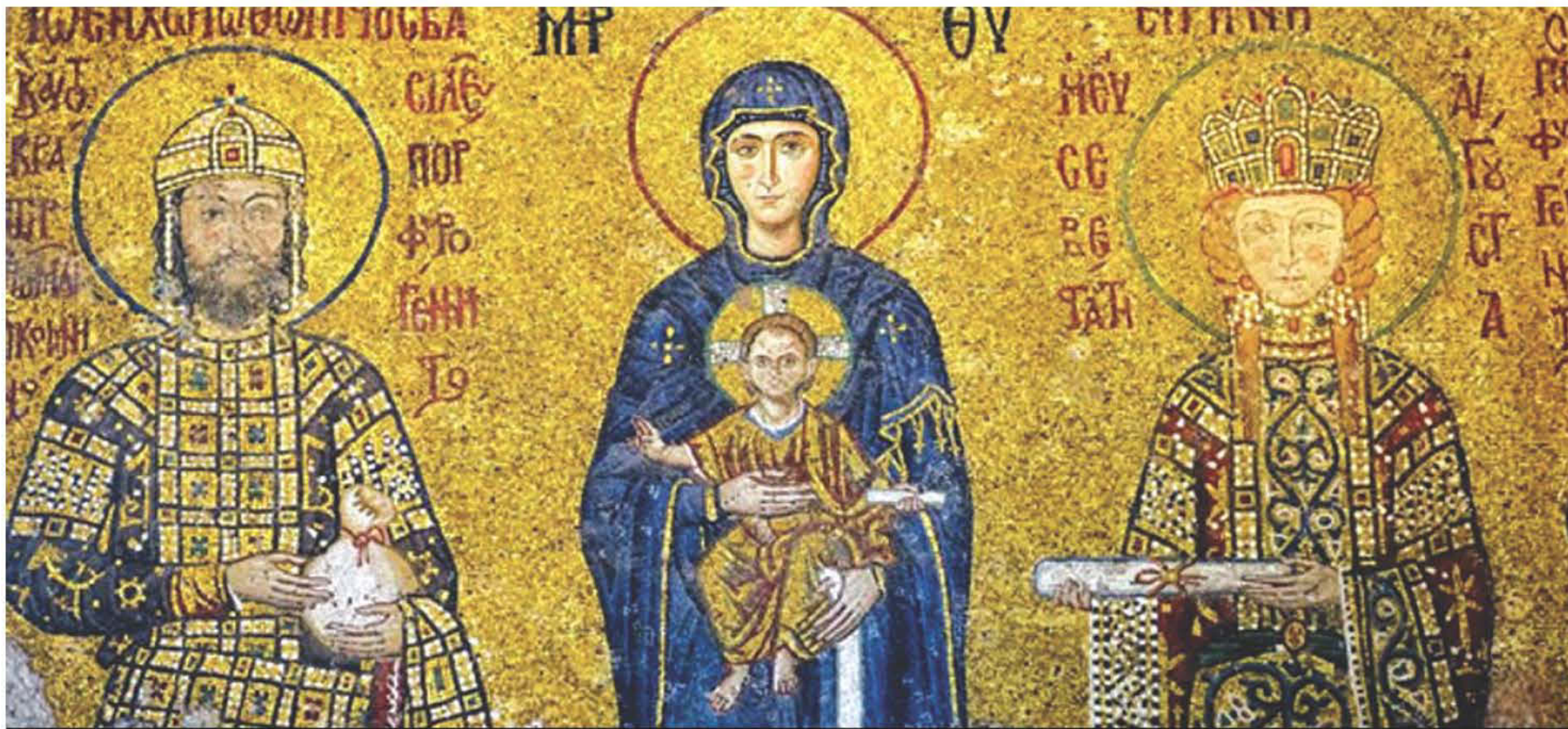
Η Πανάγια Θεοτόκος με το θείο Βρέφος μαζί με τον Ιωάνη Β' Κομνηνό και την σύζυγό του, η Ειρήνη της Ουαγγαρίας. Μωσαϊκό από τον Καθεδρικό Ναό τη Αγίας του Θεού Σοφίας Κωνσταντινούπολεως.

Μ ε τον καλύτερο τρόπο, το Πολιτιστικό Κέντρο της ΑΧΕΠΑ ΝΝΟ «Κωστής Παλαμάς» κλείνει το πρόγραμμα διαλέξεων με τίτλο «Στα μονοπάτια του Ελληνισμού» με συντονιστή τον Δρ Βασίλη Αδραχτά. Την Κυριακή 24 Νοεμβρίου, ο καθηγητής του Πανεπιστημίου του Sydney,