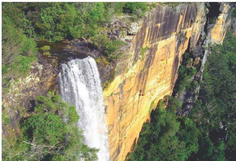
ΑΧΕΠΑ NSW INC Εκδρομή του Καφενείου 12.11.2019 ΦΩΤΟ: Το γραφικότατο Fitzroy Falls είναι στο πρόγραμμα της εκδρομής.