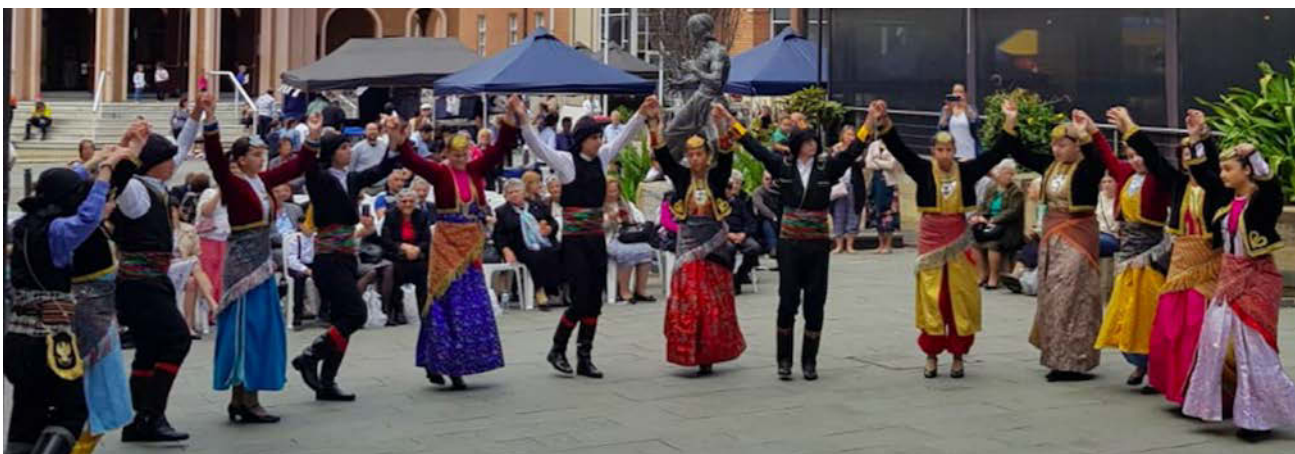
Η πλατεία μπροστά από τον Ι.Ν. της Αναστάσεως του Κυρίου, της Παναγίας της Μυρτιδιώτισσας και της Αγίας Ελέσσης με τους χορευτές του Ποντοξενιτέα στο επίκεντρο.

Η πλατεία του Kogarah στο νότιο Σύδνεϊ πλημμύρησε με ελληνισμό την Κυριακή 29 Σεπτεμβρίου 2019 για το ετήσιο Πανηγύρι της Ενορίας στον προαύλιο χώρο της Παναγίας Μυρτιδιώτισσας. Με μουσική από διάφορες περιοχές του ελληνισμού, με τα χρώματα των παραδοσιακών φορεσιών και των περιπτέρων, με τις μυρωδιές των φαγητών και γλυκών, για μερικές ώρες η πλατεία μπροστά από τον Ι.Ν. της Αναστάσεως του Κυρίου, της Παναγίας της Μυρτιδιώτισσας και της Αγίας Ελέσσης μεταμορφώθηκε σε μια νησίδα ελληνισμού στους Αντίποδες.