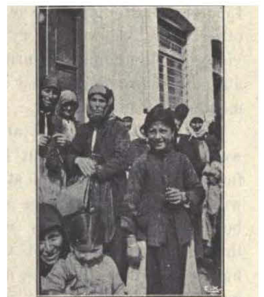
Types of Greek refugees from Kieup-Kioy; awaiting their turn at the distributing station at Rodolivos.

Πρόσφυγες/κάτοικοι από την Πρώτη Σερρών (Κιούπ-Κιοί: το χωριό ενός από τους μεγαλύτερους Έλληνες πολιτικούς, του Κωνσταντίνου Καραμανλή του πρεσβύτερου). Περιμένουν τη διανομή βοήθειας στον σταθμό του γειτονικού τους Ροδολίβους