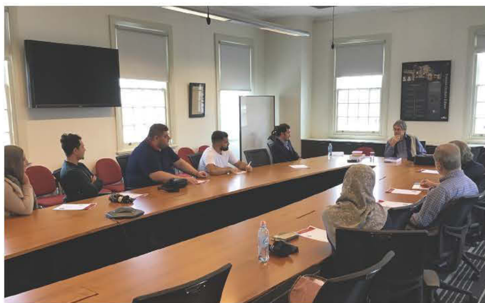
Άποψη των εργασιών του σεμιναρίου στην αίθουσα συνεδριάσεων του Whitlam Institute στο Πανεπιστήμιο του Δυτικού Σίδνεϋ