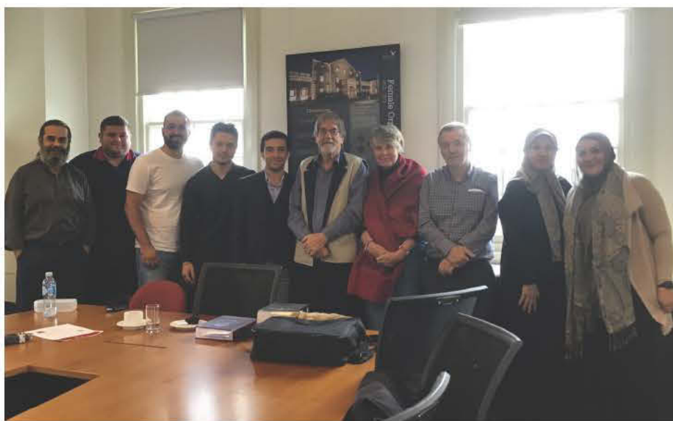
Οι διοργανωτές του σεμιναρίου με τον καθηγητή Trompf και ορισμένους από τους συμμετέχοντες