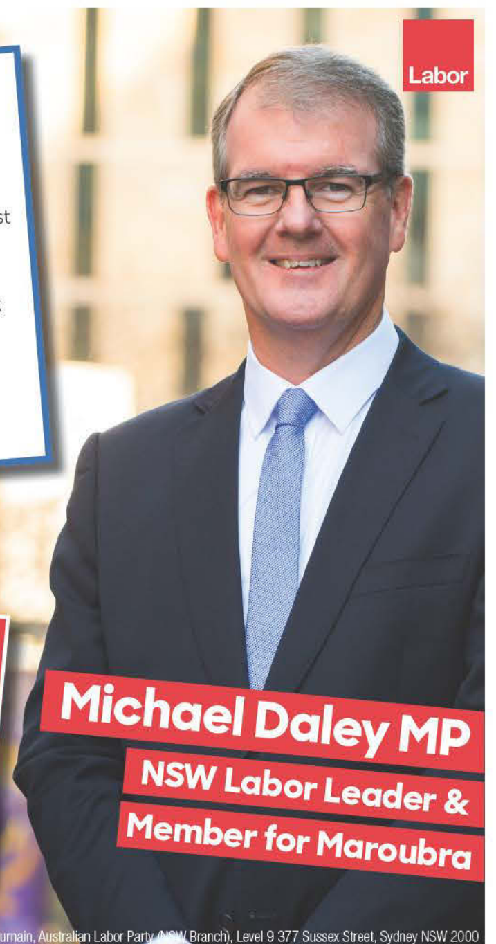
Michael Daley MP