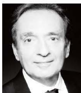
Και μοναδικές ερμηνείες του TAKH NIPBANA