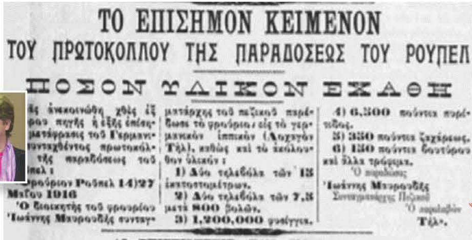
ΕΦΗΜΕΡΙΔΑ «ΜΑΚΕΔΟΝΙΑ», 10 ΟΚΤ. 1916 - ΠΡΩΤΟΚΟΛΛΟ ΠΑΡΑΔΟΣΗΣ ΡΟΥΠΕΛ