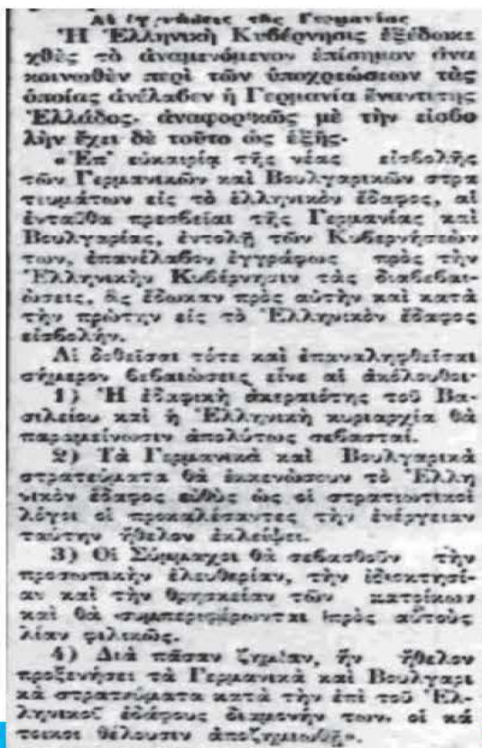
ΕΦΗΜΕΡΙΔΑ «ΑΘΗΝΑΙ» ΓΙΑ ΕΓΓΥΗΣΕΙΣ ΓΕΡΜΑΝΟ-ΒΟΥΛΓΑΡΩΝ, 9 ΑΥΓ. 1916

«Αι δοθείσαι τότε (σ.σ. κατά την 4ην Αυγούστου 1916) και επαναληφθείσαι σήμερον βεβαιώσεις (εκ μέρους των πρεσβειών Γερμανίας και Βουλγαρίας, εντολή των Κυβερνήσεών των) είναι αι ακόλουθοι: 1) Η εδαφική ακεραιότης του Βασιλείου και η Ελληνική κυριαρχία θα παραμείνουν απολύτως σεβασταί. 2) Τα Γερμανικά και Βουλγαρικά στρατεύματα θα εκκενώσουν το Ελληνικόν έδαφος ευθύς ως οι στρατιωτικοί λόγοι οι προκαλέσαντες την ενέργειαν ταύτην ήθελον εκλείψει. 3) Οι Σύμμαχοι (σ.σ. Γερμανοί και Βούλγαροι) θα σεβασθούν την προσωπικήν ελευθερίαν, την ιδιοκτησίαν και την θρησκείαν των κατοίκων και θα συμπεριφέρονται προς αυτούς λίαν φιλικώς. 4) Διά πάσαν ζημίαν ήν ήθελον προξενήσει τα Γερμανικά και Βουλγαρικά στρατεύματα κατά την επί του Ελληνικού εδάφους διαμονήν των, οι κάτοικοι θέλουσι αποζημιωθή». (Έχει διατηρηθεί η ορθογραφία της εποχής).