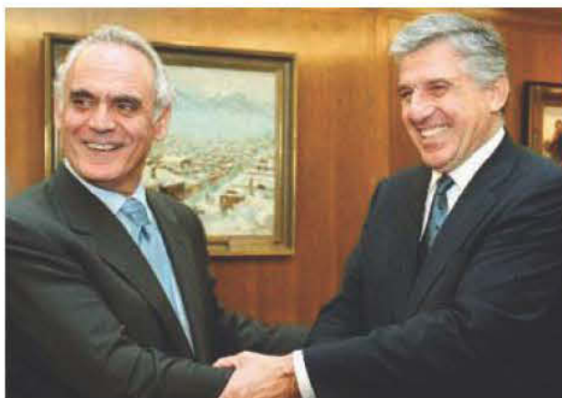
Τσοκατζόπουλος και Παπαντωνίου, δύο ακόμη από τα αστέρια του δικομματισμού που έφαγαν τον αγλέουρα και βοήθησαν στην χρεοκοπία της πατρίδας μας.

Σύμφωνα με αθηναϊκή εφημερίδα, ρωτήθηκε ο πρώην πρωθυπουργός Κώστας Σημίτης για τους υπουργούς του που εμπλέκονται σε σκάνδαλα διαφθοράς και απάντησε: «Στενοχωριέμαι, ήταν απαραίτητοι».