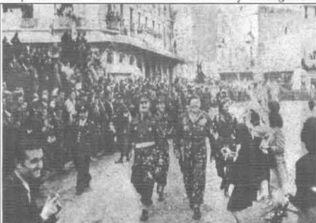
PELLED WITH CHRYSANTHEMUMS. Joyous scene in Omonia Square, Athens, following the purging of the Greek capital of the hated German. Members of a British liaison unit being pelted with chrysanthemums as they cross the square. Since the picture was taken the scene has undergone a change, and civil war has replaced the liberation festivities.

Boy Soldiers: S.E. Pastures: Gallantry Recognised: