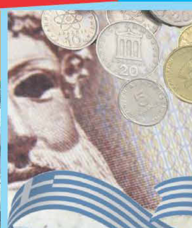
Coins and Banknotes of the Greek world