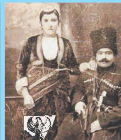
Pontos Kars Caucasus