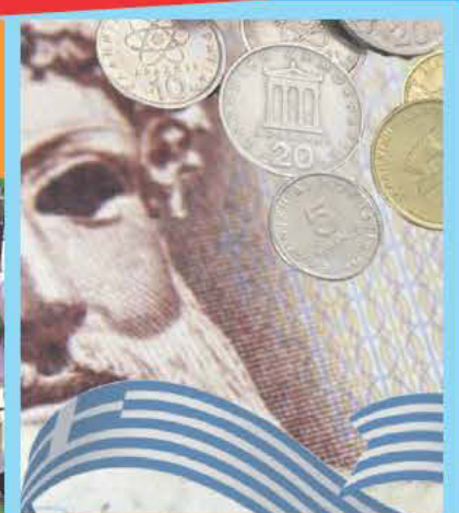
Coins and Banknotes of the Greek world