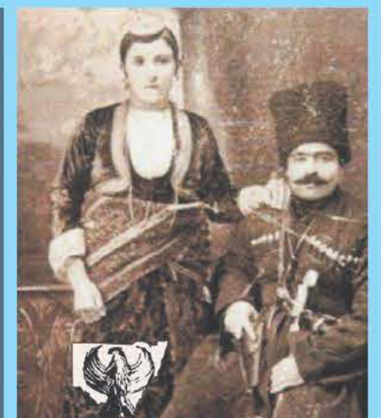
Pontos Kars Caucasus