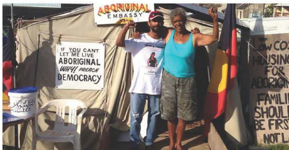
Αβορίγινες στο Ρέντφερν

Οι δυνάμεις που δημιούργησαν τον κόσμο τους στην πορεία του χρόνου προσωποποιήθηκαν σε θεές και θεούς που εξέφραζαν τον Ήλιο, τη νύχτα, τα άστρα, τη δικαιοσύνη. Μια ιδιαίτερη παρουσία, ήταν οι Wondjina, που