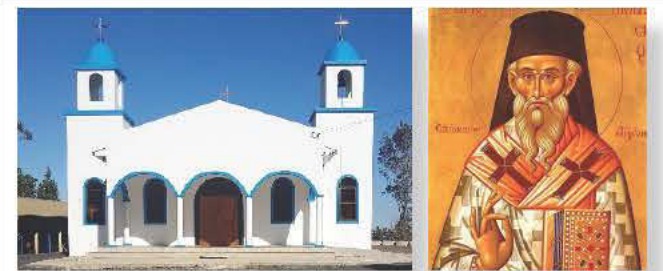
St Dionyisios Church, 21 Nurses Road, Central Mangrove, NSW 2250

Όταν έφτασαν, οι αξιωματικοί της αστυνομίας βρήκαν εκεί τον 62χρονο άντρα με τραύματα που δεν απειλούσαν τη ζωή του και, πέντε ώρες αργότερα, του απήγγειλαν τις κατηγορίες για φόνο. Η αστυνομία αρνήθηκε να σχολιάσει το εάν είναι πιθανό ο θάνατος της γυναίκας να επήλθε μετά τη λήψη ή χορήγηση ναρκωτικών.