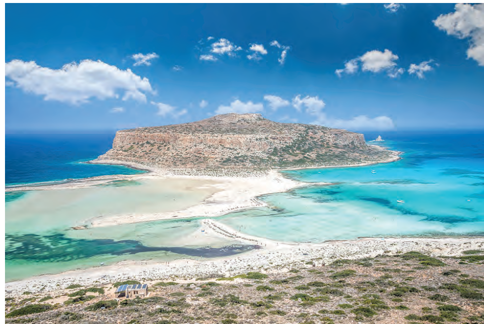
Λιμνοθάλασσα Μπάλου, Κίσαμος, Κρήτη

Grace Bay, Προβιντενσιάλες, Νήσοι Τουρκ και Κάικος Baía do Sancho, Φερνάντο ντε Νορόνια, Βραζιλία Varadero Beach, Κούβα Eagle Beach, Παλμ/Γγκλ Μπιτς, Αρούμπα Seven Mile Beach, Γκραντ Κέιμαν, Καριϊβικά