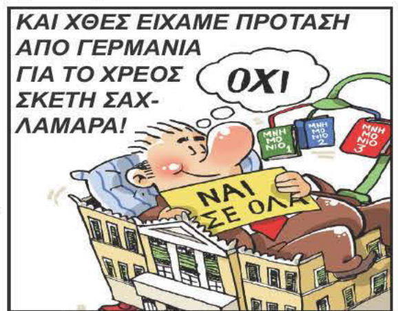
ΚΑΙ ΧΘΕΣ ΕΙΧΑΜΕ ΠΡΟΤΑΣΗ ΑΠΟ ΓΕΡΜΑΝΙΑ ΓΙΑ ΤΟ ΧΡΕΟΣ ΣΚΕΤΗ ΣΑΧ-ΛΑΜΑΡΑ! ΟΧΙ ΝΑΙ ΣΕ ΟΛΑ

βευμένο με Όσκαρ ηθοποιό, σκηνοθέτη και παραγωγό Ρόμερτ Ντε Νίρο να ξεφωνίζει οργισμένος στη διάρκεια απευθείας τηλεοπτικής μετάδοσης της τελετής απονομής των βραβείων, εναντίον του Τραμπ. Τονίζοντας «Ένα πράγμα θα πω. Να πάει να γ*** ο Τραμπ», (Επί λέξει ανέφερε «F... Trump») και οι ευρισκόμενοι στην αίθουσα ηθοποιοί του θεάτρου, σκηνοθέτες και παραγωγοί, σηκώθηκαν και χειροκροτούσαν! Ουδέν σχόλιον!