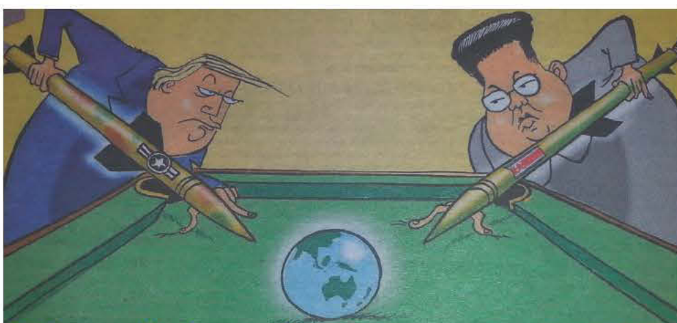
Παίζουν μπιλιάρδο με τη γή και έχουν και το πιό όμορφο μαλλί

«Η εισβολή του Ρουβίκωνα, για να στηρίξει τον Κουφοντίνα, αυτή τη φορά στο Υπουργείο Προστασίας του Πολίτη ήταν ότι πρέπει, αφού ο Ρουβίκωνας απολαμβάνει τόση προστασία από την κυβέρνηση» ήταν το νόημα της ανάρτησης του Κυριάκου Μητσοτάκη στο Τουίτερ και προσωπικά εγκρίνω και... επαυξάνω!