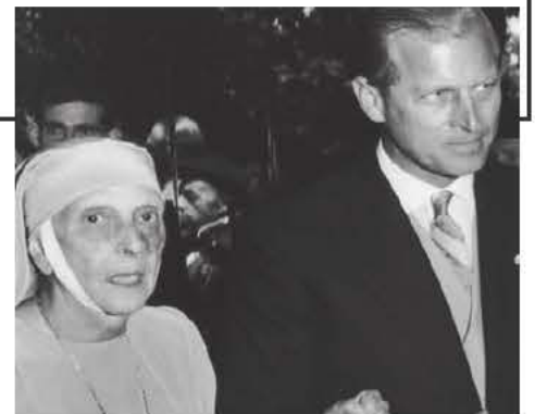
Ο Φίλιππος με τη μητέρα του Πριγκήπισσα Αλίκη

ΩΣ ΓΕΓΟΝΟΣ το ανέφερα την περασμένη Κυριακή στην ραδιοφωνική μου εκπομπή, αλλά δεν υπήρχε χώρος να το σχολιάσω εδώ χθες. Οπότε το κάνω σήμερα, επισημαίνοντας ότι η 10η Ιουνίου είναι ημερομηνία σημαδιακή για δύο Μεγάλους, οι οποίοι μάλιστα είναι δικοί μας. Ο ένας πάρα πολύ κι ο άλλος ελάχιστα!