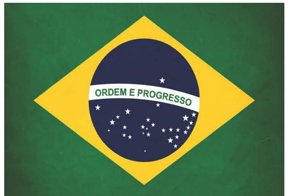
Η σημαία της Βραζιλίας. Στη μέση δεσπόζει ο Σταυρός του Νότου.

Κάτω στις ακτές της Αφρικής πάνε χρόνια τώρα που κοιμάσαι τα φανάρια πια δεν τα θυμάσαι και το ωραίο γλυκό της Κυριακής