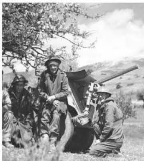
Οι σύμμαχοι της ANZAC αποφάσισαν να καθυστερήσουν τους γερμανούς εισβολείς στην κοιλάδα της Φλώρινας. Το έργο ανέλαβε ένας μεικτός σχηματισμός Αυστραλών, Βρετανών, Νεοζηλανδών και Ελλήνων, γνωστός με την ονομασία «Δύναμη Μακί» (Mackay Force). Πήρε το όνομά του από τον διοικητή του, Αυστραλό υποστράτηγο Ίβεν Μακί

Στη μάχη της στενωπού του Κλειδίου, ελληνικές και δυνάμεις των ANZAC πολέμησαν δίπλα δίπλα μέχρι τέλους. Ένας μικρός αριθμός στρατιωτών από τα δύο τάγματα της Αυστραλίας που πολέμησαν εκεί, αναφέρθηκαν ως αγνοούμενοι στη μάχη και τα πτώματά τους δεν βρέθηκαν ποτέ. Το δε βρετανικό τάγμα ανιχνευτών, που βρισκόταν δυτικότερα τοποθετημένο, νομίζοντας, πως το 2/8 υποχώρησε, συμπύχθηκε προς τον σιδηροδρομικό σταθμό Κλειδίου, με αποτέλεσμα