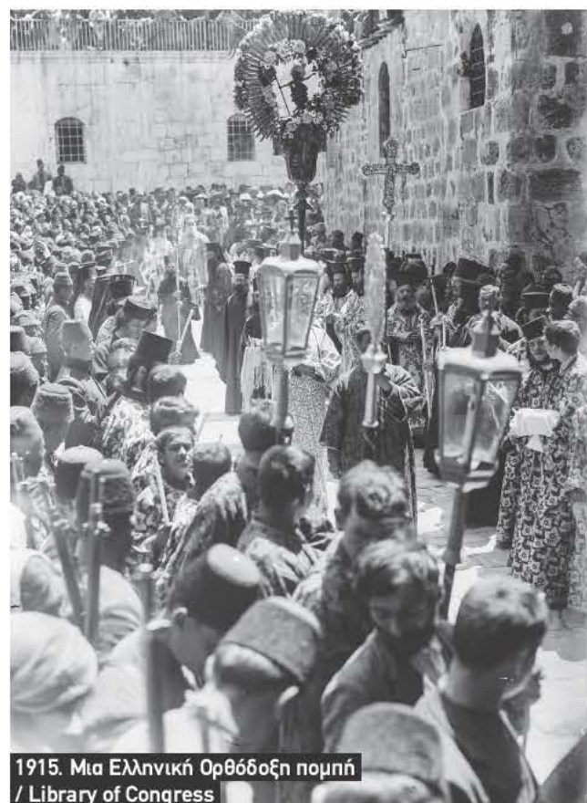
1915. Μια Ελληνική Ορθόδοξη πομπή