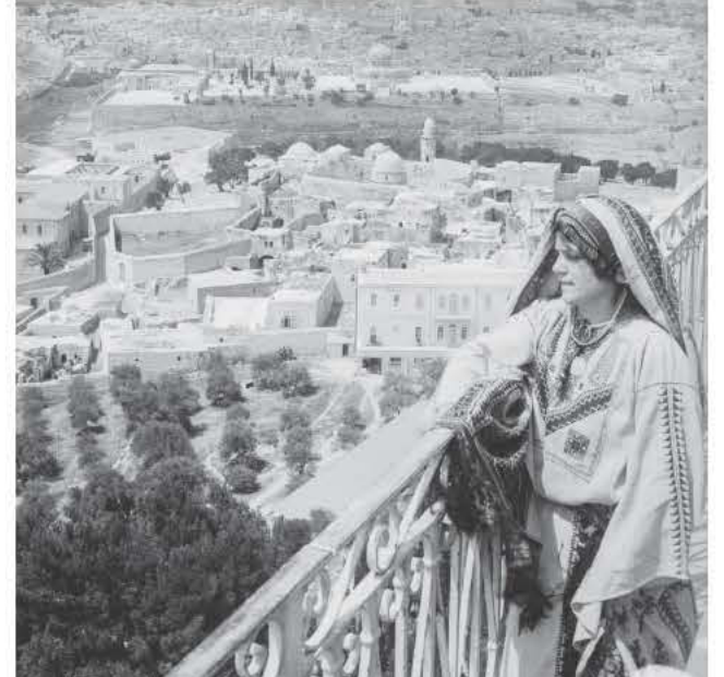
1918. Γυναίκα κοιτάζει την Ιερουσαλήμ από το Όρος των Ελαιών