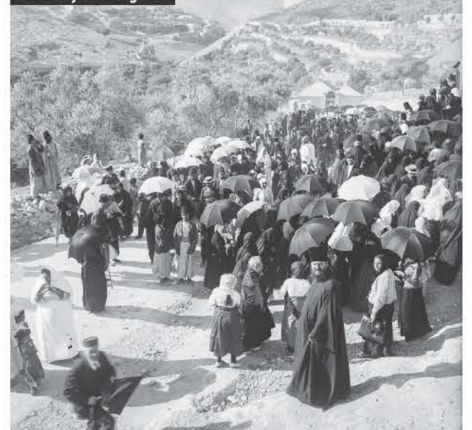
1915. Ρώσοι προσκυνητές στην Κοιλιάδα των Κέδρων