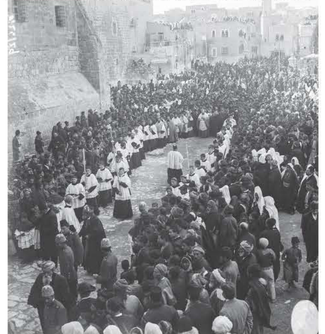
1915. Ένας καθολικός επίσκοπος φτάνει στην Ιερουσαλήμ για τις λειτουργίες των Χριστουγέννων

γνωστό ως «η παλιά πόλη» και που χωρίστηκε σε τέσσερις συνοικίες: τη μουσουλμανική, τη εβραϊκή, τη χριστιανική, και την αρμένικη. Οι παρακάτω φωτογραφίες τραβήχτηκαν κατά τη διάρκεια των τελευταίων χρόνων της οθωμανικής κατοχής, όταν η Ιερουσαλήμ ήταν η έδρα του Mutasarrifate, μέρος της ευρύτερης περιοχής που ονομαζόταν Παλαιστίνη. Κατά τη διάρκεια αυτής της περιόδου διαδοχικά κύματα εβραϊκών μεταναστευτικών πληθυσμών αύξησαν τον πληθυσμό της πόλης και του έδωσαν μία σταθερή εβραϊκή πλειοψηφία.