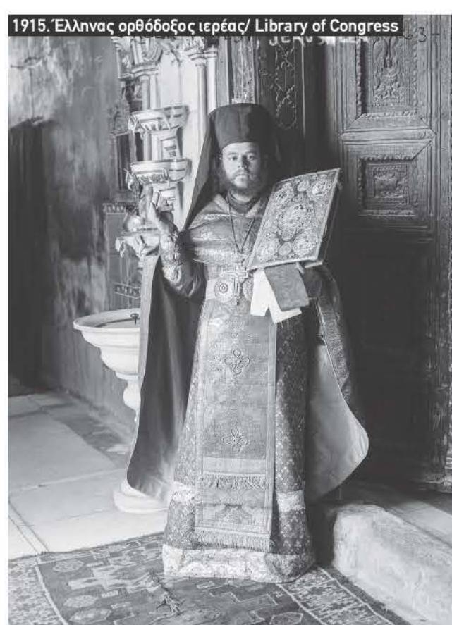
1915. Έλληνας ορθόδοξος ιερέας