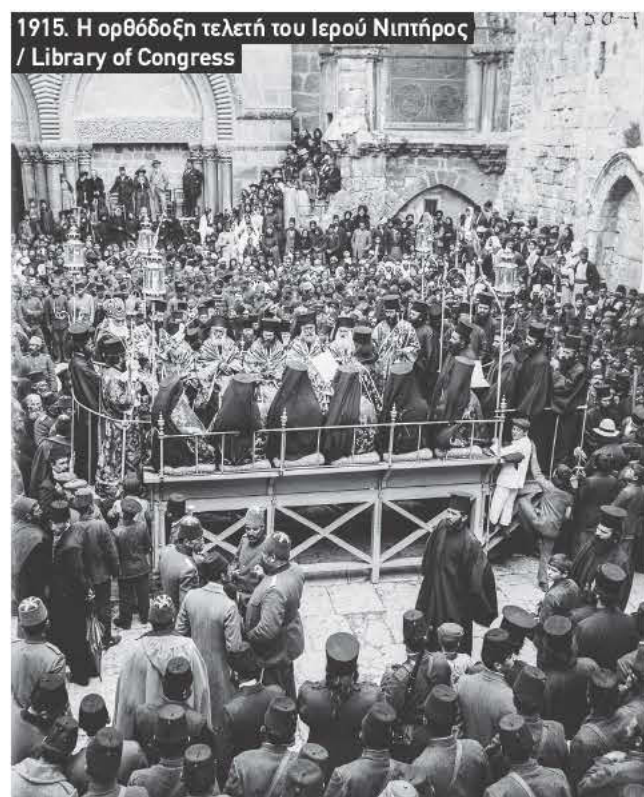
1915. Η ορθόδοξη τελετή του Ιερού Νιπτήρος