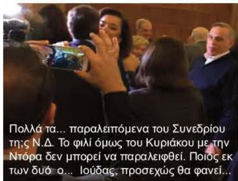
Πολλά τα... παραλειπόμενα του Συνεδρίου της Ν.Δ. Το φιλί όμως του Κυριάκου με την Ντόρα δεν μπορεί να παραλειφθεί. Ποιος εκ των δύο ο... Ιούδας, προσεχώς θα φανεί...