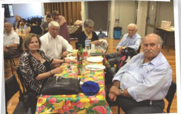
Στιγμιότυπα από την Χριστουγεννιάτικη Εορτή του «Καφενείου» της ΑΧΕΠΑ ΝΝΟ.