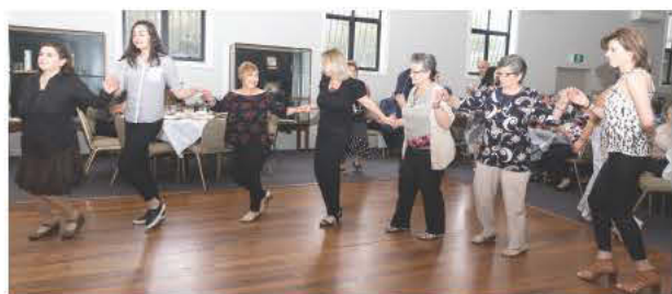
Χορός και κέφι κατά την διάρκεια της εκδήλωσης