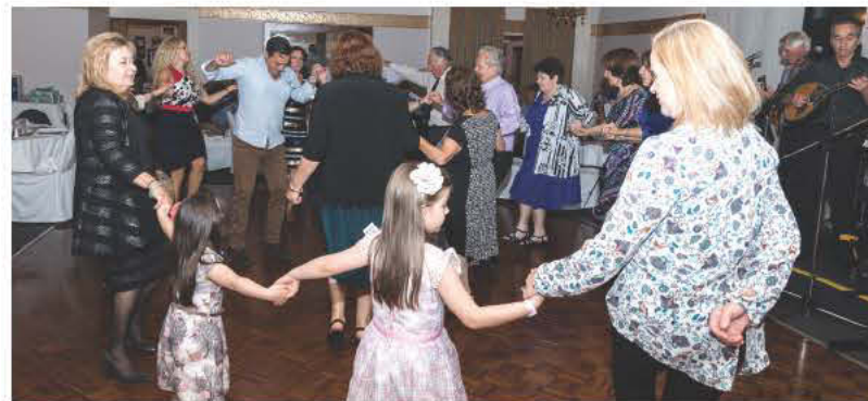
Στιγμιότυπο από το χορό